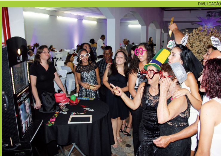
Com o toten fotográfico da Personally, as festas ficam mais divertidas e animadas

Entre em contato com a Personally Limeira e conheça um pouco mais sobre o excelente trabalho desenvolvido. “Estamos em novo endereço: Rua São Paulo, 264, no bairro Boa Vista”. Para entrar em contato pelo telefone, basta ligar no (19) 3034-1502, 98828-3492 ou 98725-2118.